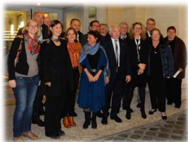
Une équipe soudée ! Délégation présente à la commission Supérieure des Sites le 16 décembre 2016

3- Contribuer activement à faire reconnaître la valeur patrimoniale des paysages agropastoraux au sein du Bien Causses & Cévennes, inscrit sur la liste du patrimoine mondial de l'humanité de l'UNESCO.