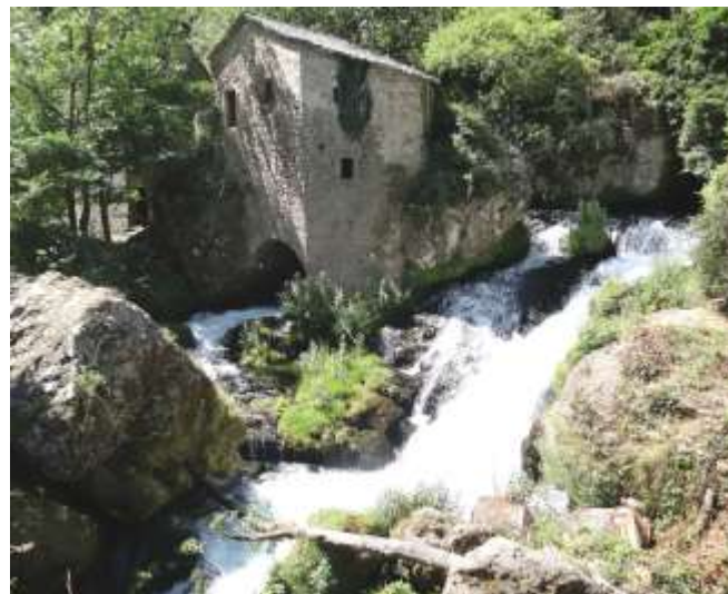
Les moulins de la Foux

La mise en œuvre de la seconde phase de l'Opération Grand Site en 2012 permet